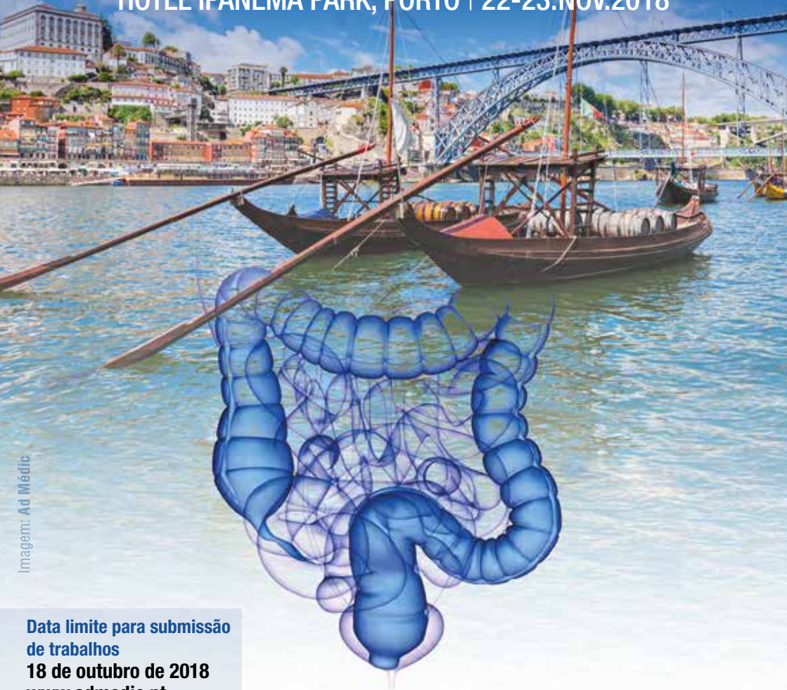
Imagem: Ad Mécic

HOTEL IPANEMA PARK, PORTO | 22-23.NOV.2018